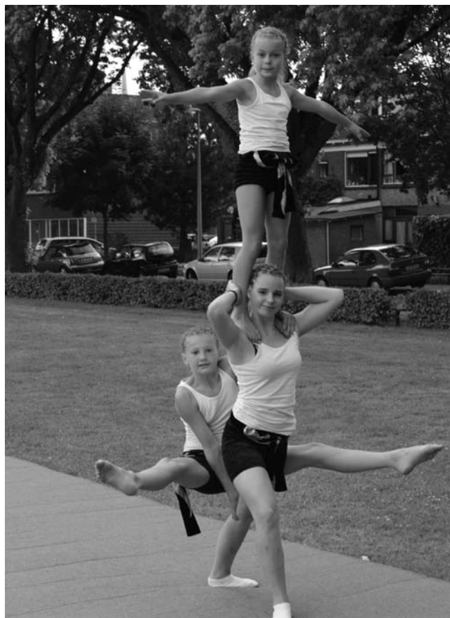
Bewoners die naar een sportvereniging gaan, hebben vaak meer vrienden in de buurt.

Het boek 'Buurten bij beleidsmakers. Stedelijke beleidsprocessen, bewonersparticipatie en sociale cohesie in vroeg-naoorlogse stadswijken in Nederland' is te bestellen bij het Koninklijk Nederlands Aardrijkskundig Genootschap in Utrecht. Surf naar www.knag.nl of bel (030) 253 40 56.