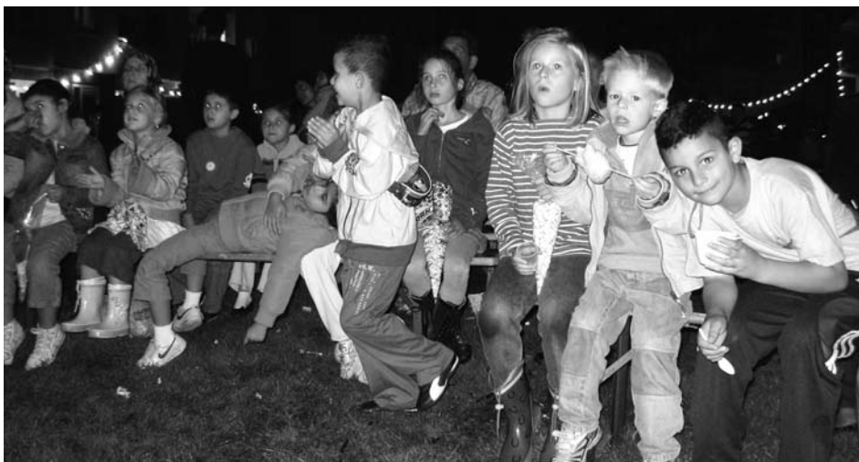
Geen filmvoorstelling is compleet zonder popcorn!