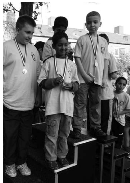
De winnaars van het voetbaltoernooi.